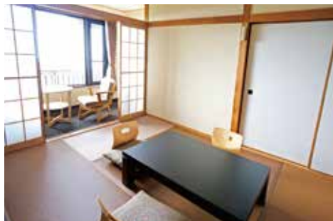
スタンダード和室