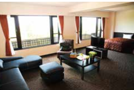
スペシャル4ベッドルーム

ご宿泊のお客様専用にて設けられたゲストラウンジでは、 ライブラリーやフリードリンクサービス 滞在中、自由にご利用いただけます。