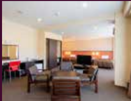
スペシャル4ベッド