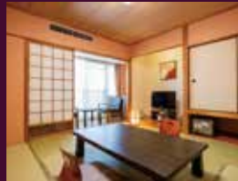
スタンダード和室