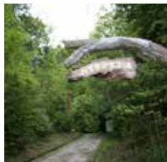
裏山のハイキングコース