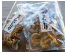
地元猪名川町産の乾燥シイタケ