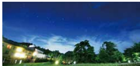
中庭からの星空観賞（夏）