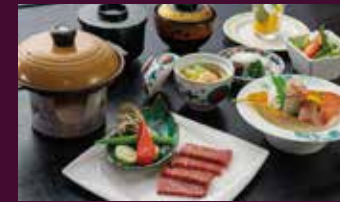
黒毛和牛鉄板焼き膳（ランチ）