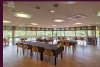
Villabli Garden Cafe（ビラブリガーデンカフェ）※土日祝営業