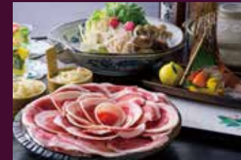
ぼたん鍋（冬季限定）